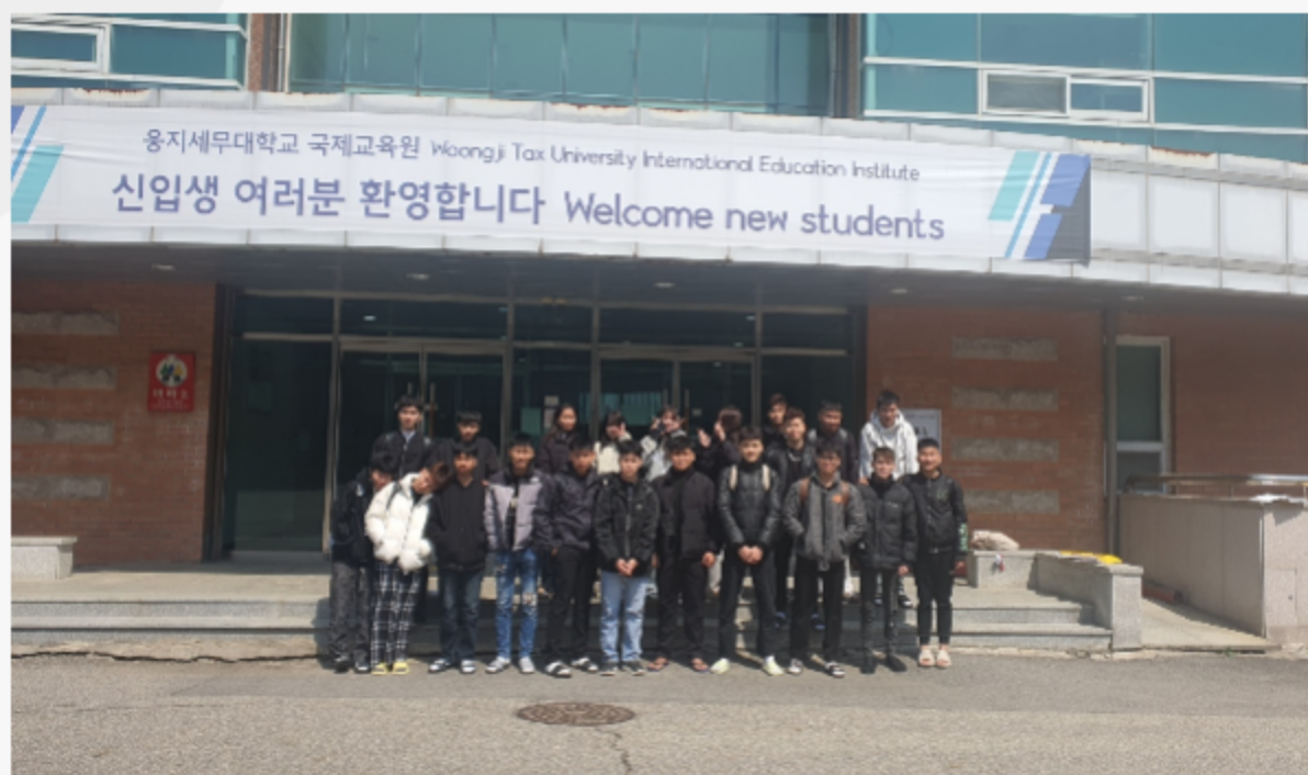
CỔNG CHÍNH HỌC VIỆN GIÁO DỤC QUỐC TẾ