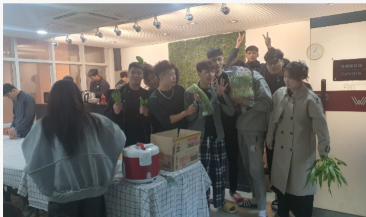
NHÀ ĂN HỌC VIỆN GIÁO DỤC QUỐC TẾ